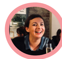
Tine Bosbok & Boskot