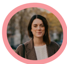
Kaat Studio Ellis